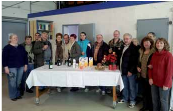
Ehrenamtliche Tafelhelfer feiern 10. Geburtstag.

Im Mai 2006 machte sich die Zülpicher Tafel selbstständig und wurde aus der „Obhut“ der Euskirchener Tafel entlassen. Als selbständiger gemeinnütziger Verein galt es nun die Arbeit für die Menschen in Zülpich, die auf Hilfe angewiesen sind, fortzusetzen. Mit zwei Kühlfahrzeugen werden sechs Mal in der Woche die Geschäfte in der Region angefahren und Lebensmittel eingesammelt.